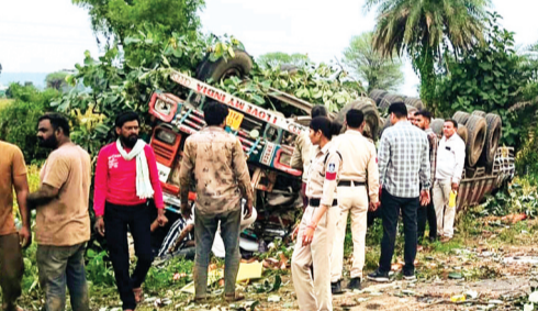
हरिभूमि न्यूज़ ►► चापड़ा

चापड़ा-बागली मार्ग पर शनिवार शाम एक दर्दनाक हादसा हुआ। हादसे में ट्रक चालक केबिन में फंसे गया, जिसे डेढ़ घंटे की कड़ी मशक्कत के बाद बाहर निकाला गया। जानकारी अनुसार ट्रक क्रमांक सीजी 04 पीए 8893 बागली से चापड़ा की ओर आ रहा था। इसी दौरान सड़क वेंचरहाउस के सामने अचानक से बकरियां सामने आ गईं जिन्हें बचाने के प्रयास में ट्रक अनियंत्रित हो गया। अनियंत्रित टुक सड़क किनारे स्थित तीन बड़े खाकर के पेड़ों को तोड़ते हुए पलट गया। हादसा इतना भयानक था कि उसे देखकर हर