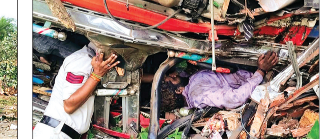
हरिभूमि न्यूज़ ►► देवास

चापड़ा-बागली मार्ग पर शनिवार शाम एक दर्दनाक हादसा हुआ। हादसे में ट्रक चालक केबिन में फंसे गया, जिसे डेढ़ घंटे की कड़ी मशक्कत के बाद बाहर निकाला गया। जानकारी अनुसार ट्रक क्रमांक सीजी 04 पीए 8893 बागली से चापड़ा की ओर आ रहा था। इसी दौरान सड़क वेंचरहाउस के सामने अचानक से बकरियां सामने आ गईं जिन्हें बचाने के प्रयास में ट्रक अनियंत्रित हो गया। अनियंत्रित टुक सड़क किनारे स्थित तीन बड़े खाकर के पेड़ों को तोड़ते हुए पलट गया। हादसा इतना भयानक था कि उसे देखकर हर